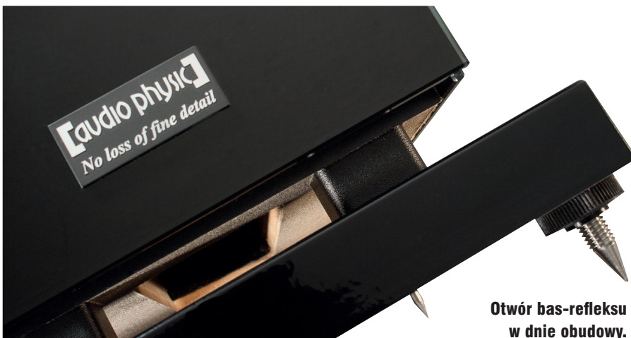
Otwór bas-refleksu w dnie obudowy.

Gdy po zakończeniu testu porządkowałem płyty, trafiłem na „Koncerty Brandenburskie”, dziwnym trafem przeoczone w czasie pierwszej części odsłu-